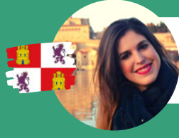
Mª Estela Lopez DIRECTORA GENERAL INSTITUTO DE LA JUVENTUD DE CASTILLA Y LEÓN